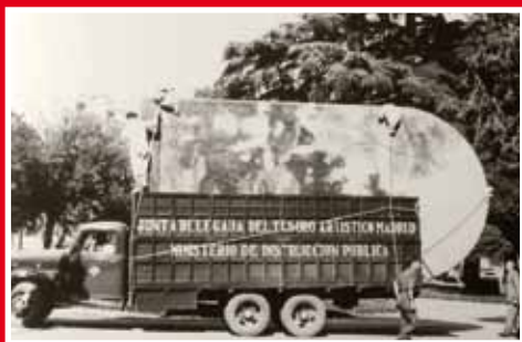
Obres del Museu del Prado carregades al camió pel trasllat a València el 23 de juliol de 1937.

aproximacions artístiques de les moltes derivades i serrells d'uns conceptes que són d'aparença oposada i que, massa sovint, conviuen en un mateix pla: la destrucció i la creació.