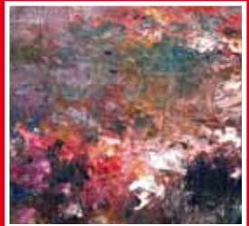
Carlos Soriano, Tristes guerras (Fotografia de la casa museu de Miguel Hernández)