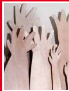
Pere Fradera, Mans cridant , 2010 Detall, fusta