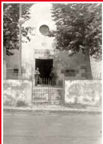
Façana del convent de les Tereses, 26 d'agost de 1936.