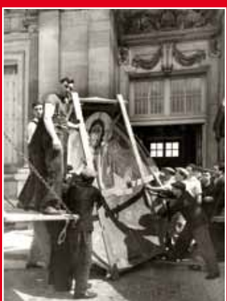
Trasllat de l'absis de Taüll a Maisons-Laffitte de París, procedent del dipòsit d'Olot. ANC. Fons 1. Generalitat de Catalunya. 2a República

El segon àmbit de la mostra, el gruix de l'exposició, centra el seu interès en com va quedar afectat el patrimoni artístic i monumental de Mataró (Santa Maria, Sant Josep, els convents de les Tereses i de les Caputxines, l'ermita de Sant Simó...) i, sobretot, en l'important paper de defensors i voluntaris que van fer possible documentar els fets i la salvaguarda de molts objectes, els que serien coneguts com la 'creu roja de l'art' de l'època.