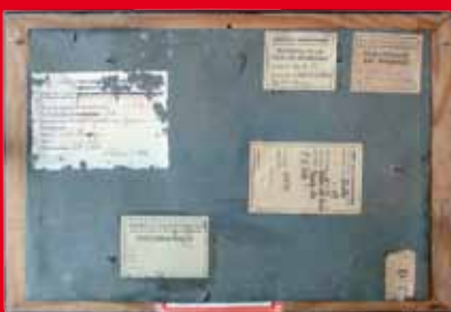
Per les etiquetes del dors podem saber el recorregut d'una obra en temps de guerra i postguerra. MAM 5816

Amb aquesta exposició, hem volgut destacar l'obra ben feta, callada i a voltes anònima, dels professionals i tècnics de cultura i de museus de l'Estat espanyol, de la Catalunya republicana i de la nostra ciutat de Mataró, així com la de molts altres ciutadans voluntaris que lluitaren (amb motivacions de diversa índole i des de posicions ideològiques prou diferenciades) en plena guerra amb les armes pacífiques de la cultura i de la raó, en circumstàncies sovint arriscades, per salvar el patrimoni artístic espanyol, català i mataroní. A tots ells, el nostre agraïment, record i homenatge.