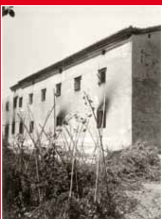
Altar major de la basílica de Santa Maria, obra de Salvador Guri, 21 de setembre de 1936. Marià Ribas / MASMM. Arxius d'imatges