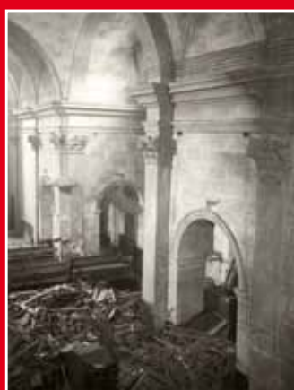
Interior de l'església de Sant Josep, 18 de setembre de 1936. Marià Ribas / MASMM. Arxius d'imatges

Desgranant el dietari pàgina a pàgina, es pot seguir el pols de la memòria de la nostra ciutat. Només així es pot convertir la memòria en història. Comença d'aquesta manera: "...Al lector d'aquestes memòries que a continuació vaig a narrar dels fets històrics i la meua intervenció en el salvament d'objectes artístics, fets ocorreguts en el període roig des del 18 de juliol de 1936... em vaig entregar amb tota l'ànima despreciant la meua vida per salvar la dels altres i objectes preciosos enmig d'aquells dies de revolució i bogeria... que no sabia si acabaria el dia en aquest món..."