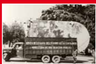
Obres del Museo del Prado carregades al camió pel trasllat a València el 23 de juliol de 1937.

En un primer àmbit de caràcter introductor i generalista, s'hi explica com va afectar la Guerra Civil espanyola al patrimoni artístic i quines accions desplegaren les autoritats republicanes en la seva defensa, amb l'exemple de l'evacuació del Museo del Prado de Madrid i la salvaguarda de les principals obres del patrimoni artístic català.