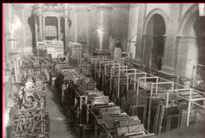
Església de Sant Esteve d'Olot condicionada com a magatzem per dipositar les principals obres de l'art català.

Les guerres tenen, com és obvi, un alt cost humà, social, econòmic, polític... però també patrimonial, perquè els arxius, els museus, les biblioteques, el patrimoni arquitectònic i les obres d'art també en poden ser víctimes. Les imatges ben recents de la destrucció i saqueig de la Biblioteca Nacional i el Museu Arqueològic de Bagdad a la guerra de l'Iraq o els budes destruïts pels talibans a l'Afganistan ens ho han recordat. Una vegada més, el present ens retorna al passat i ens demostra que la història sovint és cíclica.